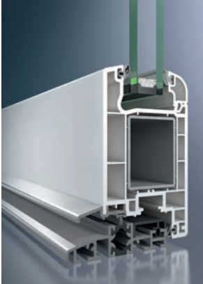
Schüco Corona CT 70 Die Basistür